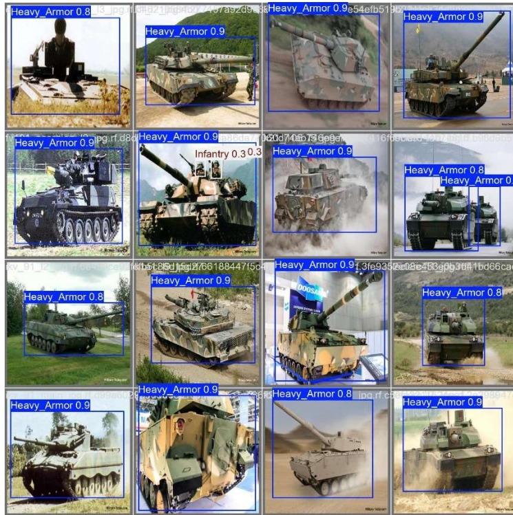
Рисунок 2 – Приклад роботи квантованої моделі YOLOv8n (INT8) з виявлення та класифікації цілі на тестовому зображенні

Для оцінки роботи моделі комп'ютерного зору проаналізовано візуальні результати інференсу на тестовій вибірці. Як продемонстровано на рисунку 2, квантована модель успішно справляється із задачею виявлення та класифікації пріоритетних цілей типу «Heavy_Armor» та «Infantry» навіть за складних ракурсів зйомки.