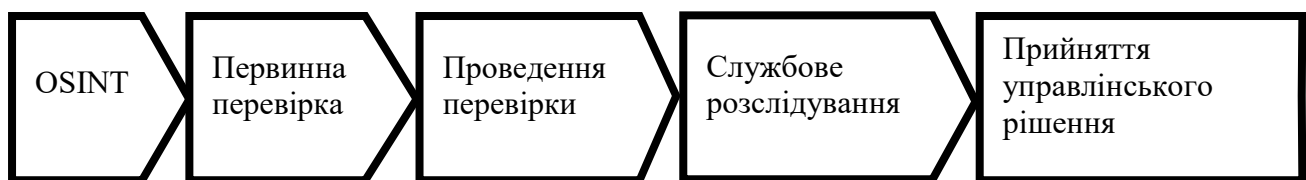
Схема 1. Модель застосування OSINT у діяльності Служби правопорядку

Окремої уваги потребує питання допустимості використання OSINT як доказової бази. Інформація з відкритих джерел може використовуватися як фактичні дані за умови дотримання критеріїв законності, достовірності, цілісності та можливості бути перевіреною. У цьому контексті доцільним є застосування міжнародних стандартів документування цифрових доказів, зокрема Берклійського протоколу щодо цифрових розслідувань із використанням відкритих джерел [14].