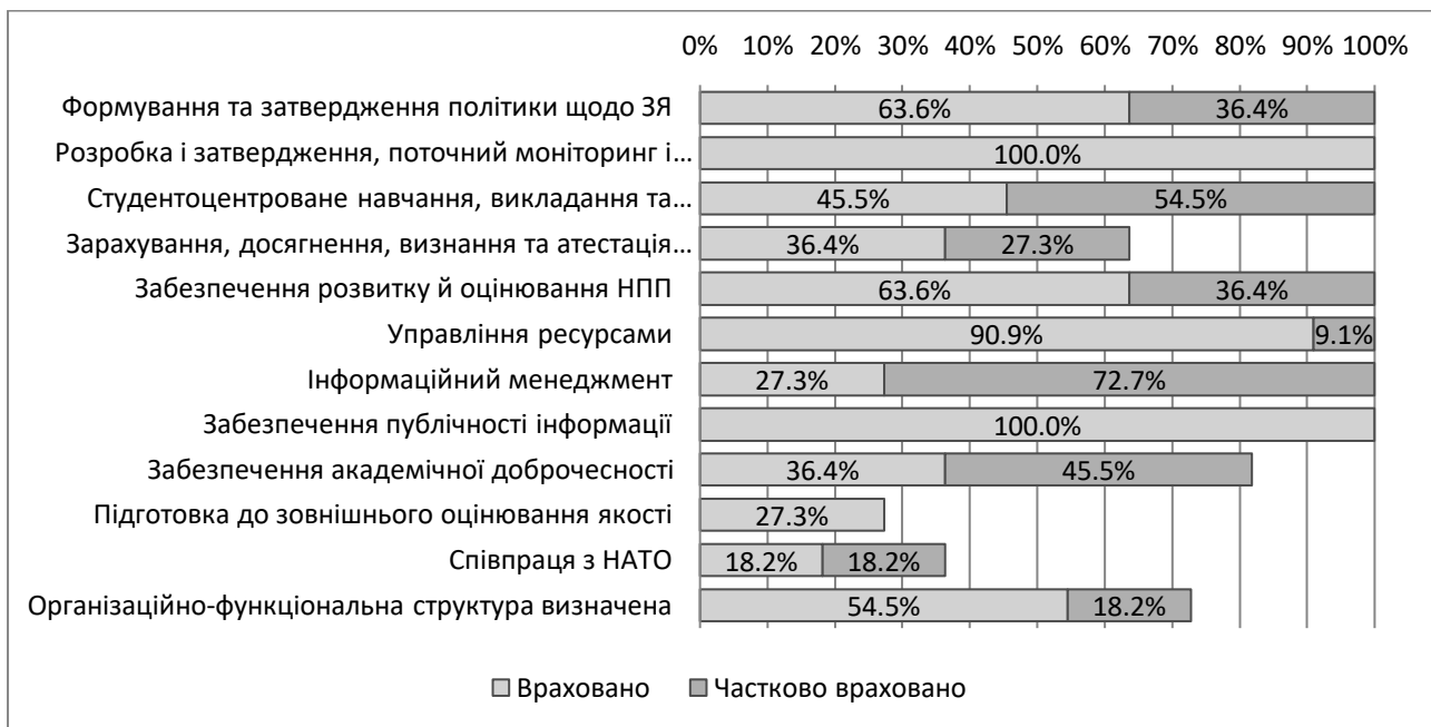
Рис. 1. Оцінка відповідності нормативних документів ВВНЗ з якості визначеним процедурам СВЗЯО

Подальшого удосконалення потребує процедура інформаційного менеджменту. У редакції ESG 2015 року на відміну від версії 2005 року стандарт "Інформаційні системи" замінено на "Інформаційний менеджмент", що передбачає забезпечення закладами вищої освіти збору, аналізу і використання відповідної інформації для ефективного управління освітніми програмами та іншою діяльністю. Водночас, ВВНЗ зосередили свою увагу на розвитку електронних інформаційних систем та ресурсів, і тільки три з них (27.3%) враховують ширший контекст цієї процедури.